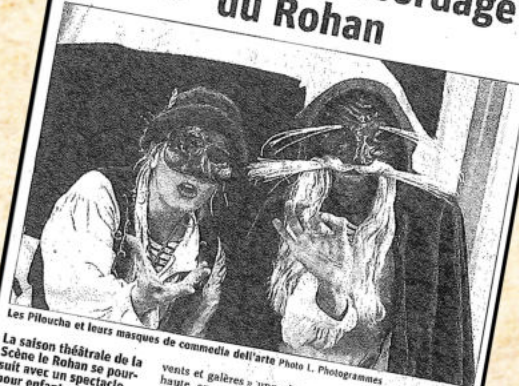
Les Piloucha et leurs masques de comédie dell'arte

La saison théâtrale de la Scène le Rohan se poursuit avec un spectacle pour enfants, le 17 décembre prochain. À la Compagnie Piloucha qui débarque à Mutzig avec sa dernière création « Frimousse contre vents et galères ».